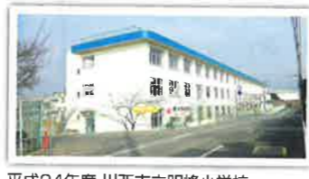
平成24年度 川西市立明峰小学校 南校舎棟耐震補強等工事 設計者：榊山建築設計室 完成日：2014年3月 構造・規模：RC造 3F 延床面積4182㎡