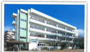
八雲中学校校舎棟耐震補強工事 設計者：榊山建築設計室 完成日：2014年1月 構造・規模：RC造 4F 延床面積2537.60㎡