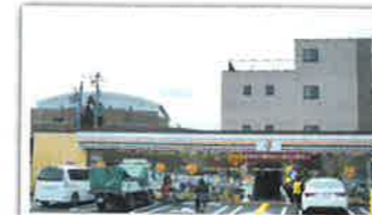
セブンイレブン大阪大桐3丁目店新築工事 設計者：(有)五輪設計 完成日：2014年2月 構造・規模：軽量鉄骨造 平屋 建築面積208.95㎡