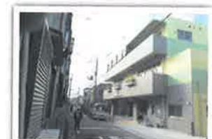
大島南保育園改築工事 設計者：靑尾建築設計事務所 完成日：2014年1月 構造・規模：RC造 3階建て 延床面積1455.76㎡