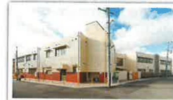
社会福祉法人聖森会 たちばな保育園新築工事 設計者：株式会社 企画設計社 完成日：2013年12月 構造・規模：RC造 2F 1186.52㎡