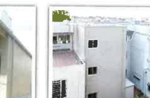
南小学校エレベーター新設置工事 設計者：株式会社 宮本設計 完成日：2013年8月 構造・規模：S造 3F 72.6㎡