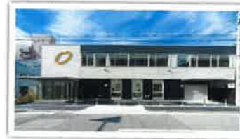
日米総本社社屋新築工事 設計者：自社 完成日：2013年11月 構造・規模：S造 2F 施工床面積704.63㎡