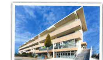
大久保中学校校舎耐震補強工事 設計者：株式会社 東畑建築事務所 完成日：2014年3月 構造・規模：RC造 4F建て 延床面積2629㎡ プレース補強12か所他