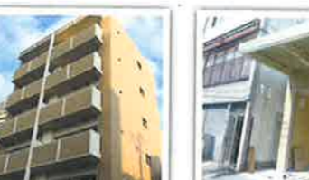
大成印刷所・生江倉庫新築工事 設計者：自社 完成日：2014年2月 構造・規模：S造 平屋 49.24㎡