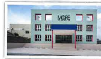
モアコスメティックス工場研究所新築工事 設計者：榊山建築設計事務所 完成日：2013年12月 構造・規模：S造 2F 延床面積1628.34㎡