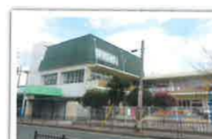
てしま保育園耐震補強工事に伴う改修工事 設計者：大塚謙太郎一級建築士事務所 完成日：2014年2月 構造・規模：RC造 3F 延床面積1401.86㎡