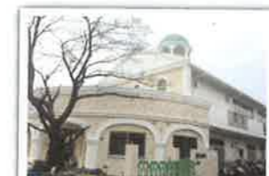
第二光の峰保育園新築工事 設計者：金下建設株式会社一級建築事務所 完成日：2014年2月 構造・規模：RC造一部S造 2階建て 延床面積1158.70㎡