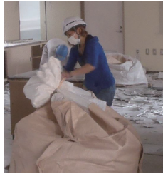
作業をするいしさん

建設業界で仕事をする女性も増えて来ています。当現場でも女性ならではの細かい気配りや明るさが活気を生んでいます。少しお話を伺いました。 Q:この仕事を何年ですか？ A:1年とちょっとです。 Q:この仕事を選んだ理由は？ A:楽しそうだったからです。 Q:仕事でよかったことは？ A:体を使うことが好きなのでやりがいも有りますし、職場のみんながやさしくしてくれるので楽しいです。 Q:最後に仕事に対する意気込みをお願いします。 A:みんなのために明るく頑張ります。